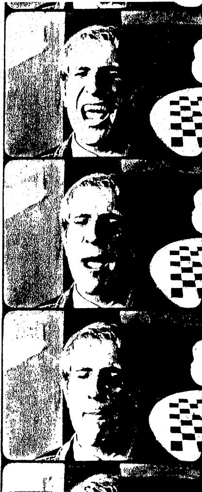
Bildfolge aus AM RAND von Ferry Radax

5. (1962) FENSTERGUCKER, ABFALL, ETC. (55 m, 16 mm, stumm). Bewegungsstudien über Menschen (nur rechts und links über die Schulter aufgenommen, die Bildbewegung links- oder rechtsläufig) und Fenster sowie Fenstergucker (Menschen, die aus Fenstern gucken). Dazwischenmontiert, unter besonderer Anwendung der Unschärfe, Abfallhaufen. Extreme Wirklichkeit wird dem Zuschauer offeriert. Die Bilder sind nicht polemisch gestellt, sondern wie in den vorhergehenden Filmen nach einer Reihentechnik geordnet. Der Film ist eine Mischung aus Langmontage (wie Film Nr. 1) und Kurzmontage (wie Nr. 2—4). 6. (1964) PAPA UND MAMA, MATERIALAKTION MÜHL (41 m, Farbe, 16 mm, stumm) 7. (1964) LEDA UND DER SCHWAN, MATERIALAKTION MÜHL (30 m, Farbe, 16 mm, stumm): Kren wird provokanter, er verfilmt Materialaktionen Otto Mühls (typische Wiener Abarten des Happenings), in denen der menschliche Körper wie andere Materialien durch zweckfremden Einsatz „verwandelt“ werden. Das abstrakte Formgefühl Krens ist dem Destruktionstrieb Mühls entgegengesetzt, die Filme gewinnen erst bei oftmaligem Betrachten. Sie sind nach Reihenschemen wie die vorhergehenden gleich im Negativ geschnitten (siehe Planschema zu Film 6). Ein gewisses aleatorisches Element ist nicht nur bei der Aktion des Malers, sondern auch bei der Herstellung